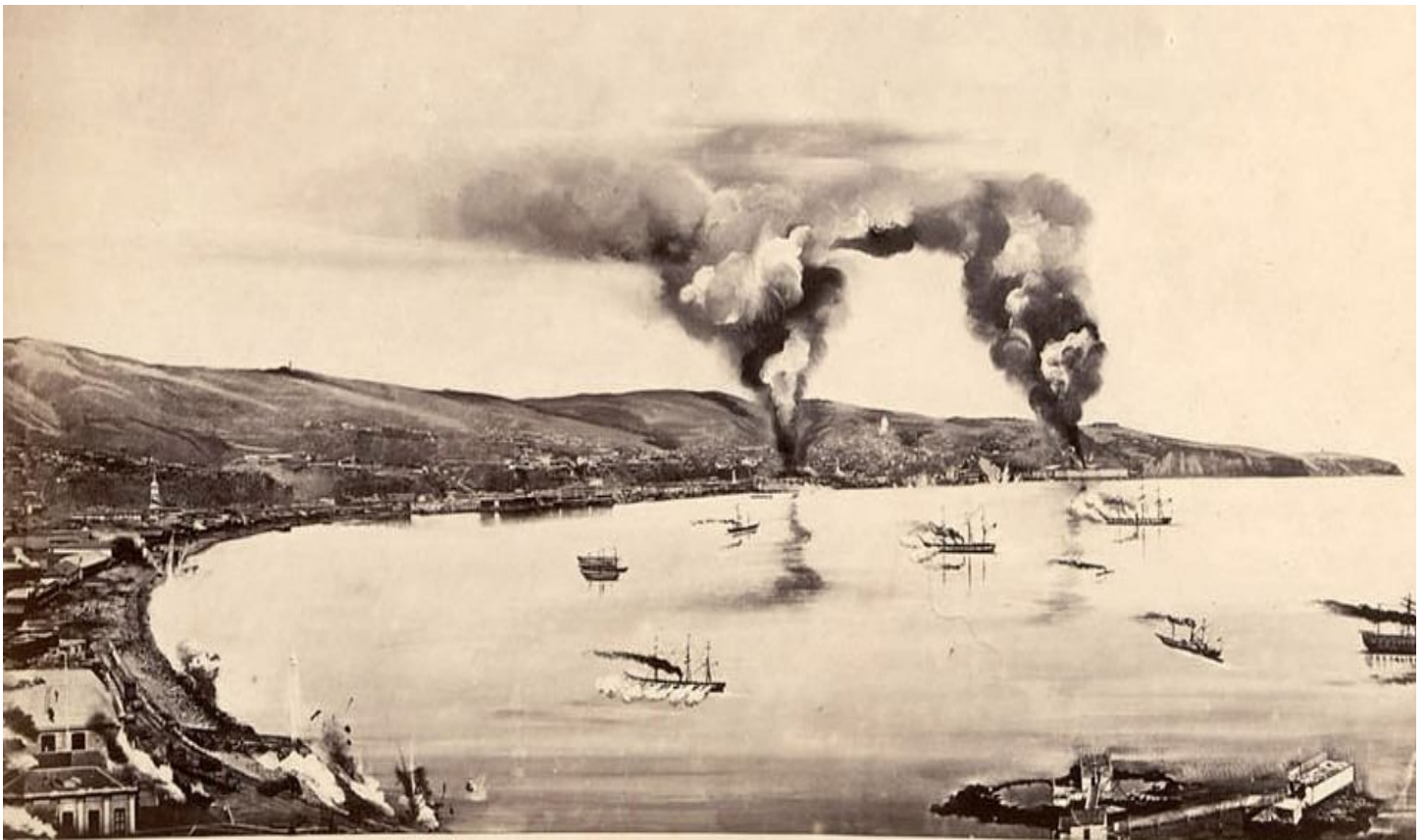
Grabado del Bombardeo a Valparaíso (31 de marzo de 1866)

En respuesta, el almirante español Casto Méndez Núñez, ordenó el bombardeo de Valparaíso. El 31 de marzo de 1866, el principal puerto chileno soportó durante dos horas y media el embate español. El puerto quedó arruinado y los almacenes francos destruidos; días más tarde los buques españoles se dirigieron a Callao, pero no lograron dañarlo, gracias a la prevención de las autoridades peruanas.